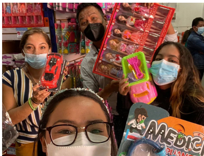
“FE-stival de la Niñez” en Aldea el Rodeito del municipio Pueblo Nuevo Viñas, departamento de Santa Rosa.