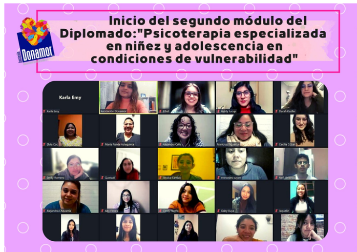
Proceso de Formación para Psicólogos y Psicólogas