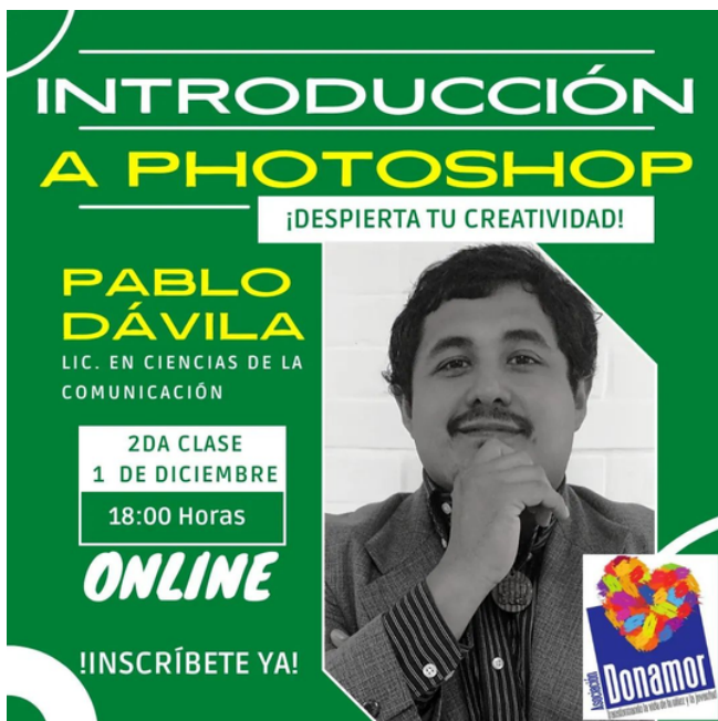
Flyer promocional del taller organizado por el Staff de Capacitación