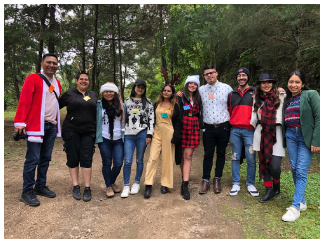
Convivencia de Voluntarios realizada en el mes de diciembre.