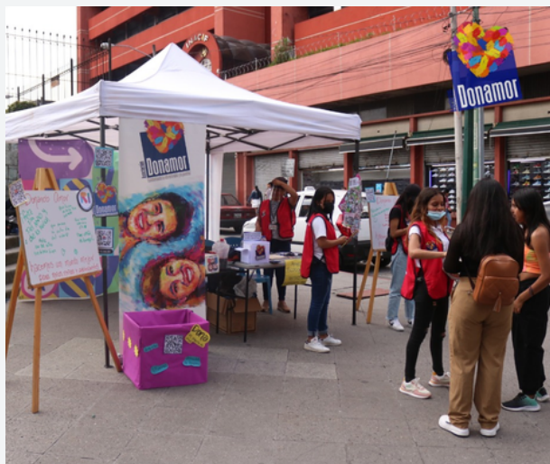
Actividad de Recaudación, Sexta Avenida, Zona 1