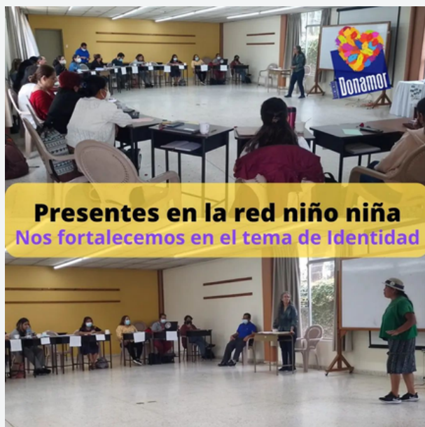
Participación en La Red Niño Niña