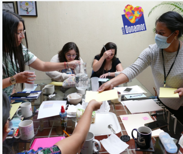
Inducción a Nuevos Voluntarios Psicólogos